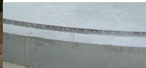
Ingjutningsstål i botten

Kontakta oss för mer information och offert!